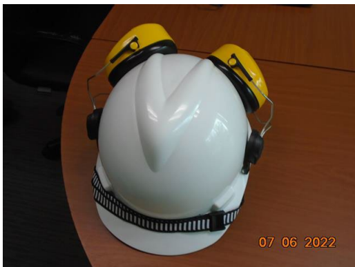
ภาพที่ 2-9 อุปกรณ์ลดเสียง