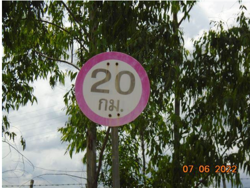
ภาพที่ 2-22 ป้ายจำกัดความเร็วยานพาหนะ