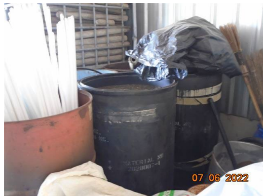
ภาพที่ 2-28 ถังใส่กากเรซิน