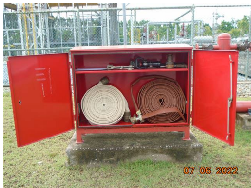
ตู้เก็บสายท่อน้ำดับเพลิง (Fire Hose Cabinet)