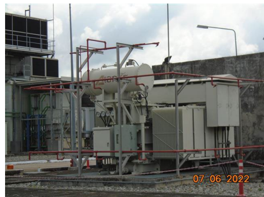
ภาพที่ 2-59 ระบบหัวกระจายน้ำดับเพลิงอัตโนมัติ (Automatic System)