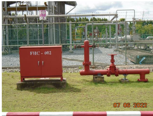
หัวฉีดน้ำดับเพลิง (Yard Hydrant)