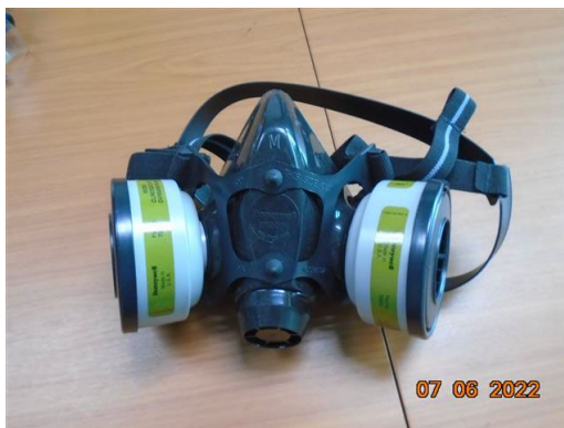
ภาพที่ 2-39 หน้ากากป้องกันสารเคมี