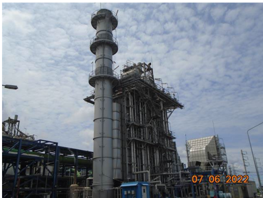
ภาพที่ 2-5 ปล่อง HRSG#12