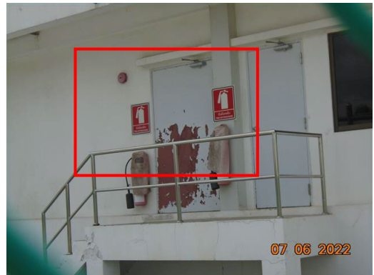
ภาพที่ 2-65 อุปกรณ์ดับเพลิง บริเวณท่อส่งก๊าซธรรมชาติ