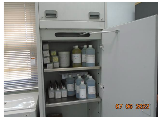
ภาพที่ 2-34 ตู้เก็บสารเคมีอันตราย