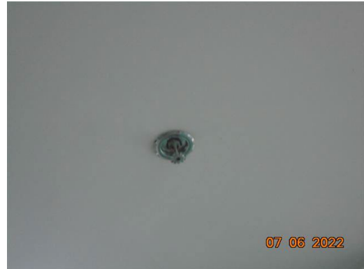
ภาพที่ 2-55 อุปกรณ์ตรวจจับความร้อน (Heat Detector)