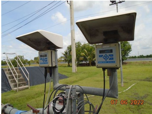
ภาพที่ 2-19 pH Online และ Conductivity Online บริเวณบ่อกักน้ำทิ้ง