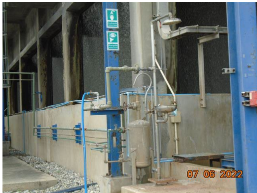
ภาพที่ 2-35 อุปกรณ์ชำระล้างลูกเดิน