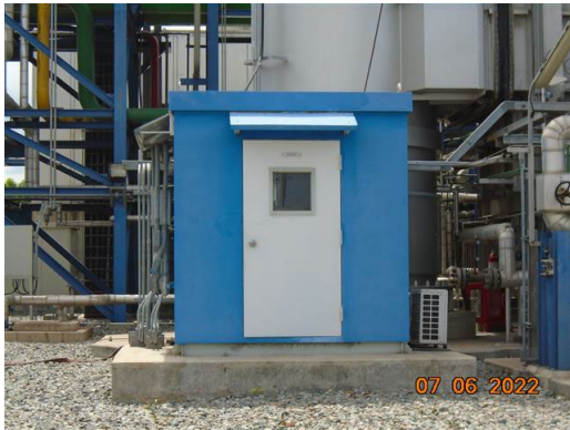
ภาพที่ 2-3 ระบบ CEMs ของปล่อง HRSG#12