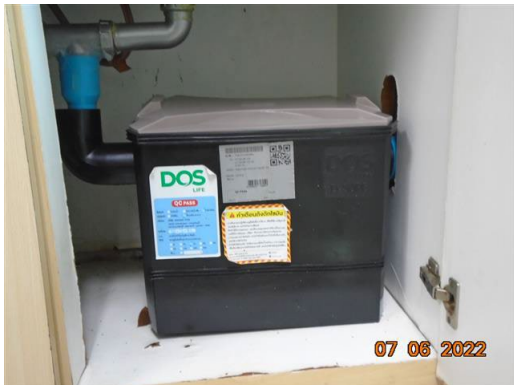
ภาพที่ 2-13 ถังบำบัดน้ำเสียสำเร็จรูป