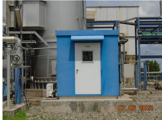
ภาพที่ 2-2 ระบบ CEMs ของปล่อง HRSG#11