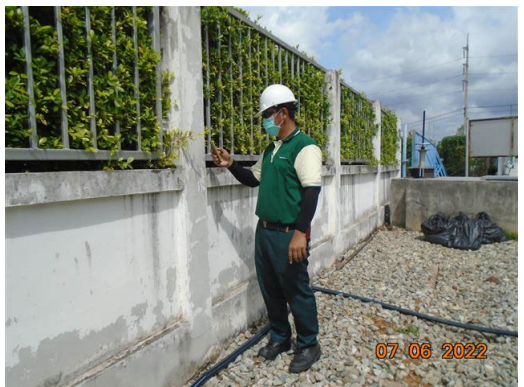
ภาพที่ 2-67 เจ้าหน้าที่รักษาความปลอดภัย ตรวจสอบพื้นที่โครงการ