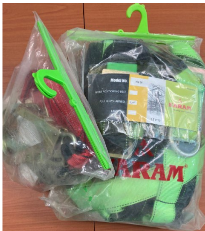
ภาพที่ 2-47 เชือกนิรภัย