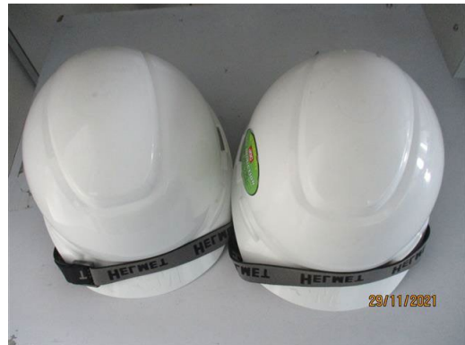
ภาพที่ 2-44 หมวกนิรภัย