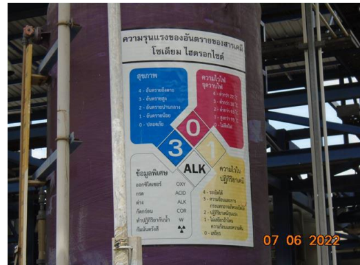
ภาพที่ 2-33 ป้ายเตือนอันตรายสารเคมี