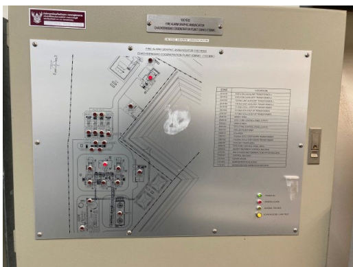
ภาพที่ 2-58 ระบบแจ้งเตือนเหตุเพลิงไหม้