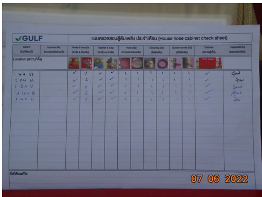
ภาพที่ 2-53 การตรวจสอบอุปกรณ์ดับเพลิง