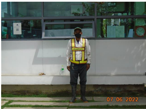
ภาพที่ 2-24 พนักงานรักษาความปลอดภัย