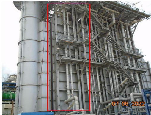
ภาพที่ 2-30 ฉนวนป้องกันความร้อน (Insulation)