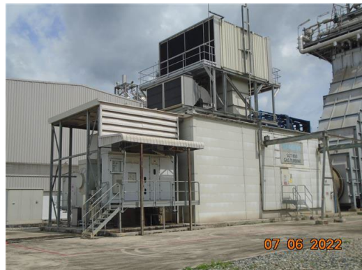
ภาพที่ 2-6 ห้องเครื่องจักร บริเวณห้องเผาไหม้ของเครื่องกังหันก๊าซ