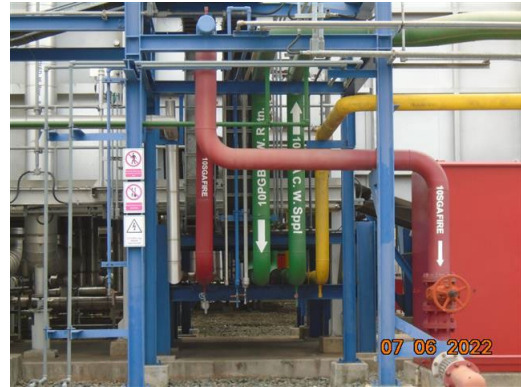
ภาพที่ 2-50 ระบบการทาสีและเครื่องหมาย ตัวอักษร แสดงทิศทางการไหลของระบบท่อและอุปกรณ์ต่างๆ