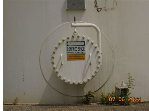
ภาพที่ 2-52 บริเวณที่อับอากาศ