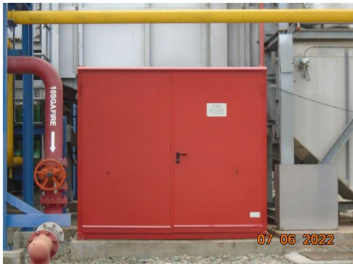
ภาพที่ 2-64 CO 2 Gas Spray