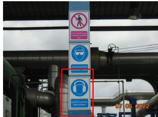
ภาพที่ 2-8 ป้ายเตือนบริเวณที่มีเสียงดัง