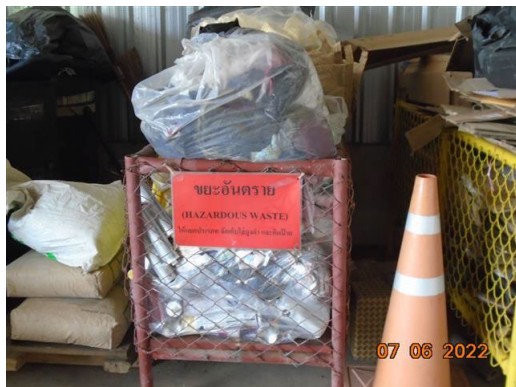
ภาพที่ 2-27 สถานที่จัดเก็บกากของเสียอันตราย