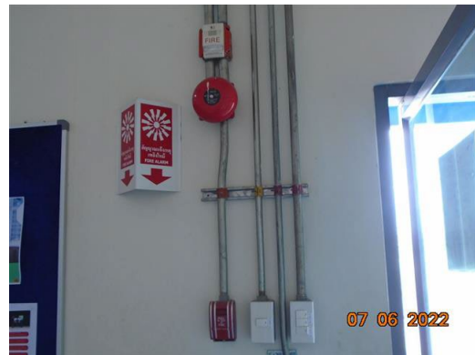
ภาพที่ 2-57 สัญญาณแจ้งเตือนเหตุเพลิงไหม้ (Fire Alarm)