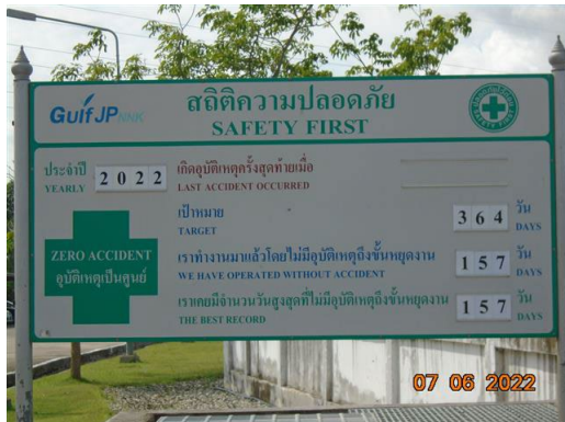
ภาพที่ 2-43 ป้ายสถิติความปลอดภัย