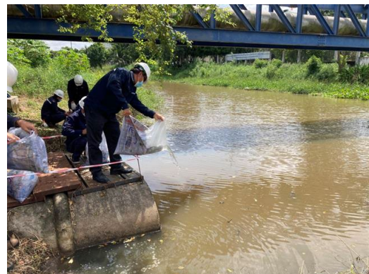
ภาพที่ 2-71 กิจกรรมปล่อยพันธุ์ปลา