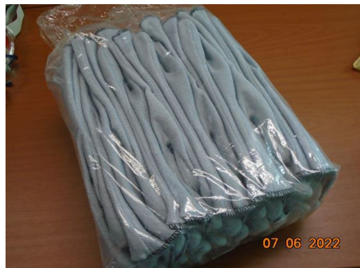
ภาพที่ 2-46 ถุงมือนิรภัย