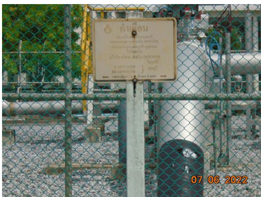
ภาพที่ 2-68 ป้ายแสดงแนวท่อและขอบเขตพื้นที่ข้างแนวท่อส่งก๊าซธรรมชาติ