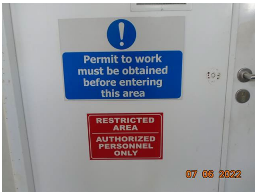
ภาพที่ 2-66 ป้ายประกาศเขตพื้นที่หวงห้าม