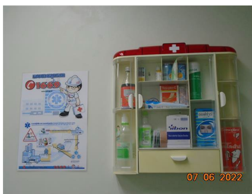
ภาพที่ 2-41 ห้องปฐมพยาบาลและอุปกรณ์ปฐมพยาบาลเบื้องต้น