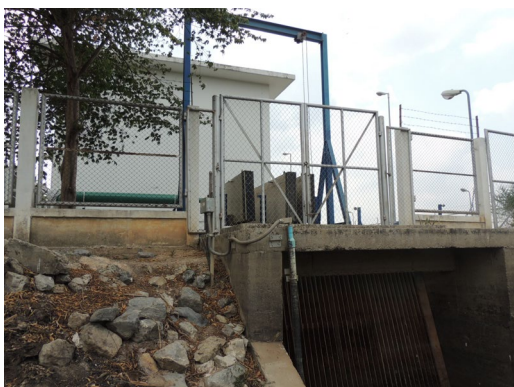
ภาพที่ 2-11 คลองพระองค์ไชยานุชิต บริเวณเขตที่ดินของโครงการ