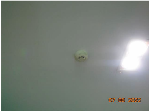
ภาพที่ 2-54 อุปกรณ์ตรวจจับควัน (Smoke Detector)