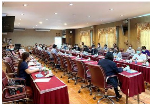
ภาพที่ 2-69 การประชุมคณะกรรมการการมีส่วนร่วม