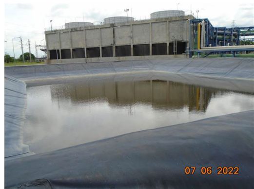
ภาพที่ 2-18 บ่อพักน้ำทิ้ง