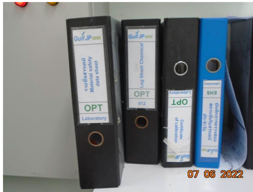
ภาพที่ 2-32 แฟ้มข้อมูลความปลอดภัย (Safety Data Sheet; SDS)