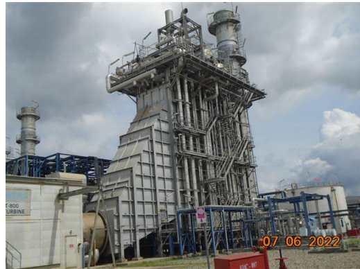
ภาพที่ 2-4 ปล่อง HRSG#11