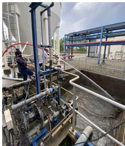
ภาพที่ 2-40 การทำความสะอาดโครงการ