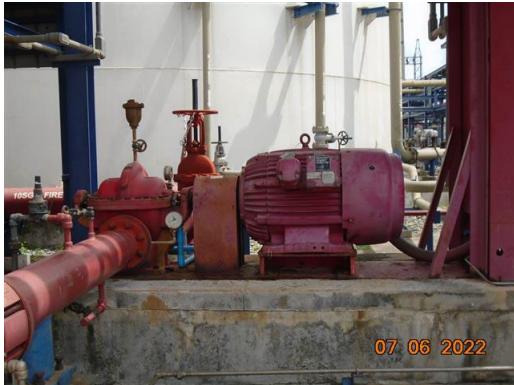
ภาพที่ 2-60 เครื่องสูบน้ำดับเพลิงหลัก