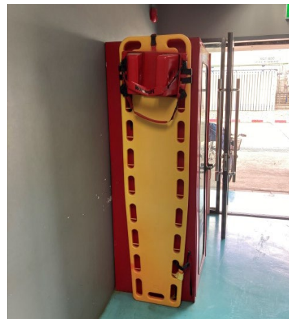
ภาพที่ 2-48 เปลสนาม