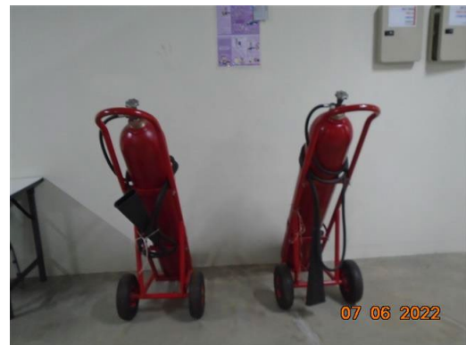
ถังดับเพลิงชนิดคาร์บอนไดออกไซด์