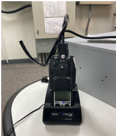
ภาพที่ 2-56 อุปกรณ์ตรวจสอบการรั่วไหลของก๊าซ (Gas Detector)