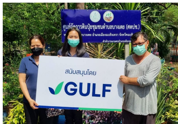
ภาพที่ 2-70 ตัวอย่างกิจกรรมชุมชนสัมพันธ์