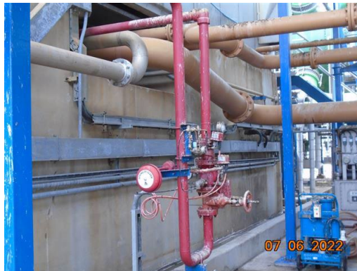
ภาพที่ 2-63 Fire Water Spray System บริเวณ Steam Turbine Generator Bearing Area