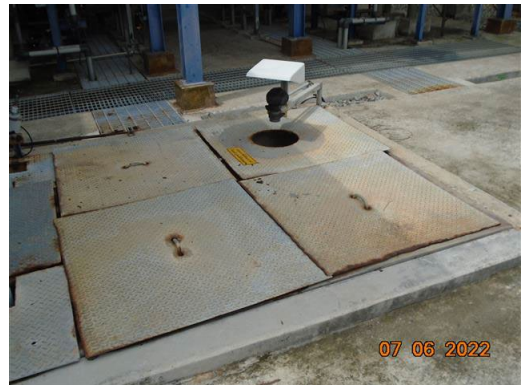
ภาพที่ 2-16 บ่อปรับสภาพน้ำ (Neutralization Pit)