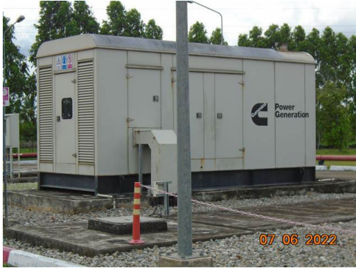
ภาพที่ 2-51 ระบบไฟฟ้าสำรอง