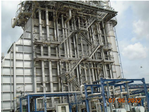
ภาพที่ 2-49 บันได ทางเดิน และชั้นลอย