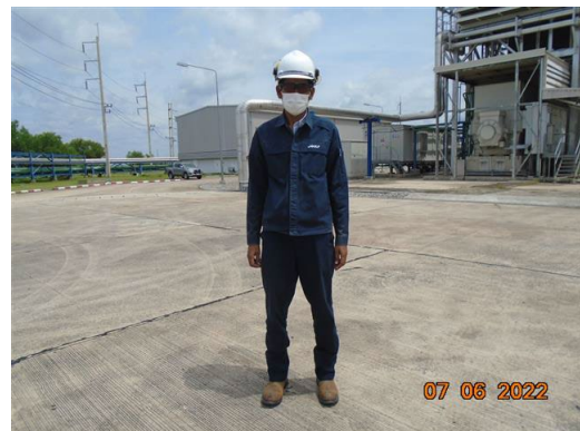
ภาพที่ 2-10 พนักงานสวมใส่อุปกรณ์คุ้มครอง ความปลอดภัยส่วนบุคคล