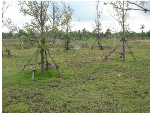
ภาพที่ 2-20 การนำน้ำทิ้งที่ผ่านการบำบัดแล้ว กลับมาใช้ซ้ำภายในพื้นที่โครงการ