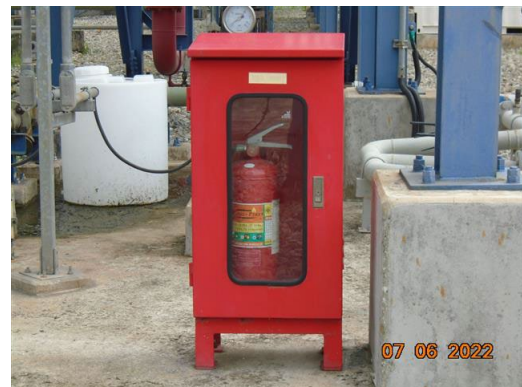
ถังดับเพลิงแบบมือถือ ชนิดสารเคมีแห้ง