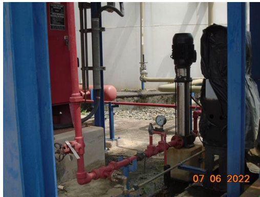
ภาพที่ 2-62 เครื่องสูบน้ำรักษาความดันน้ำดับเพลิง (Jockey Pump)