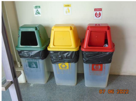
ภาพที่ 2-25 ถังขยะแยกประเภท