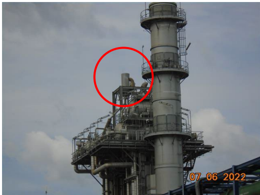
ภาพที่ 2-7 Silencer ที่ Safety Valve