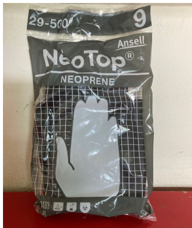
ภาพที่ 2-37 ถุงมือป้องกันสารเคมี