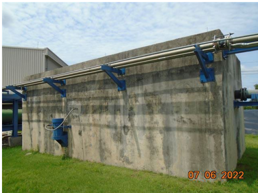
ภาพที่ 2-15 บ่อแยกน้ำและน้ำมัน