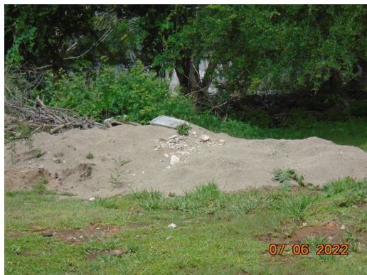
ภาพที่ 2-29 การนำกากตะกอนจากระบบปรับปรุงคุณภาพน้ำประปรมที่ดิน