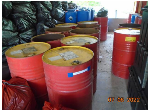
ภาพที่ 2-26 ภาชนะใส่น้ำมันที่ใช้แล้ว