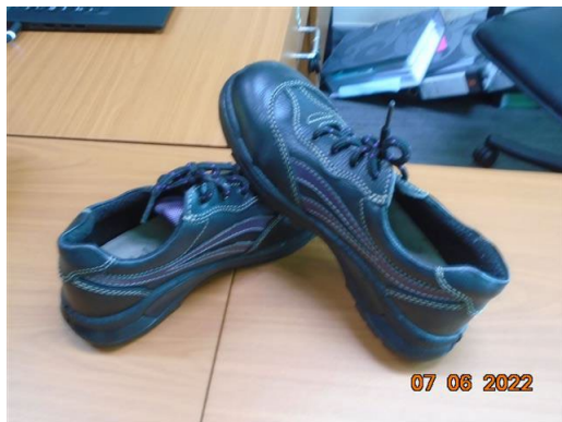
ภาพที่ 2-45 รองเท้านิรภัย