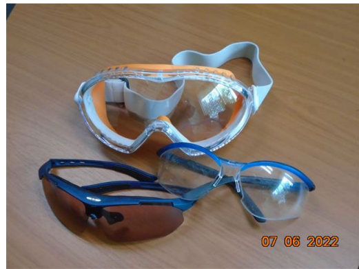
ภาพที่ 2-38 แว่นตานิรภัย