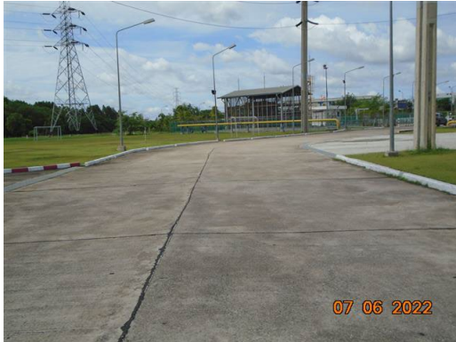
ภาพที่ 2-21 ถนนภายในโครงการ