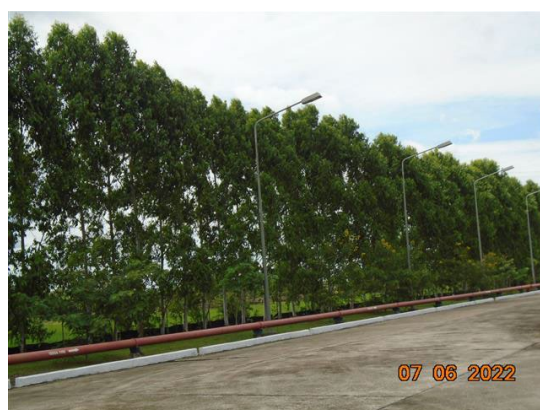
ภาพที่ 2-72 พื้นที่สีเขียว