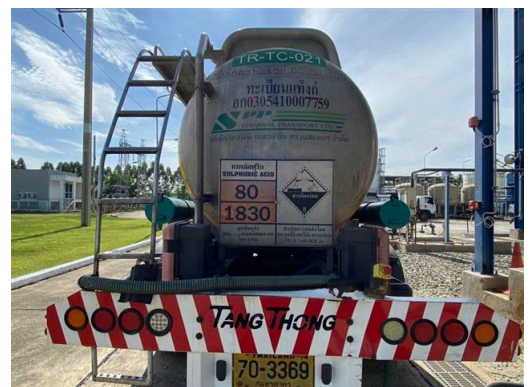
ภาพที่ 2-31 เครื่องหมายฉลาก และป้ายบนรถขนส่งวัตถุอันตราย