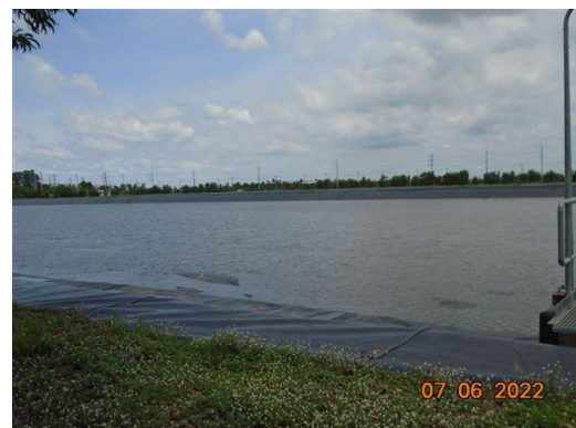
ภาพที่ 2-12 บ่อเก็บสำรองน้ำดิบ