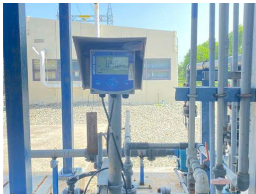
ภาพที่ 2-17 pH Online บริเวณบ่อปรับสภาพน้ำ (Neutralization Pit)