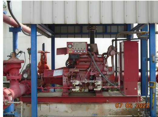
ภาพที่ 2-61 เครื่องสูบน้ำดับเพลิงสำรอง