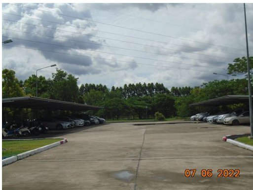
ภาพที่ 2-23 ลานจอดรถ