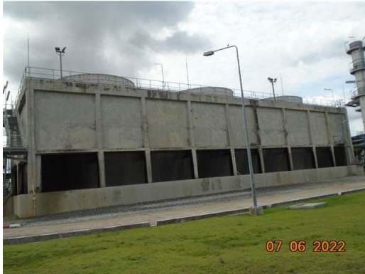
ภาพที่ 2-1 หอหล่อเย็น (Cooling Tower)