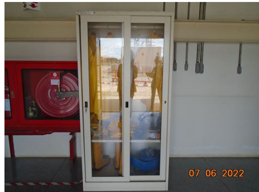
ภาพที่ 2-36 ชุดป้องกันสารเคมี