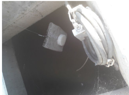
ภาพที่ 2-14 การเติมคลอรีนลงในน้ำทิ้ง